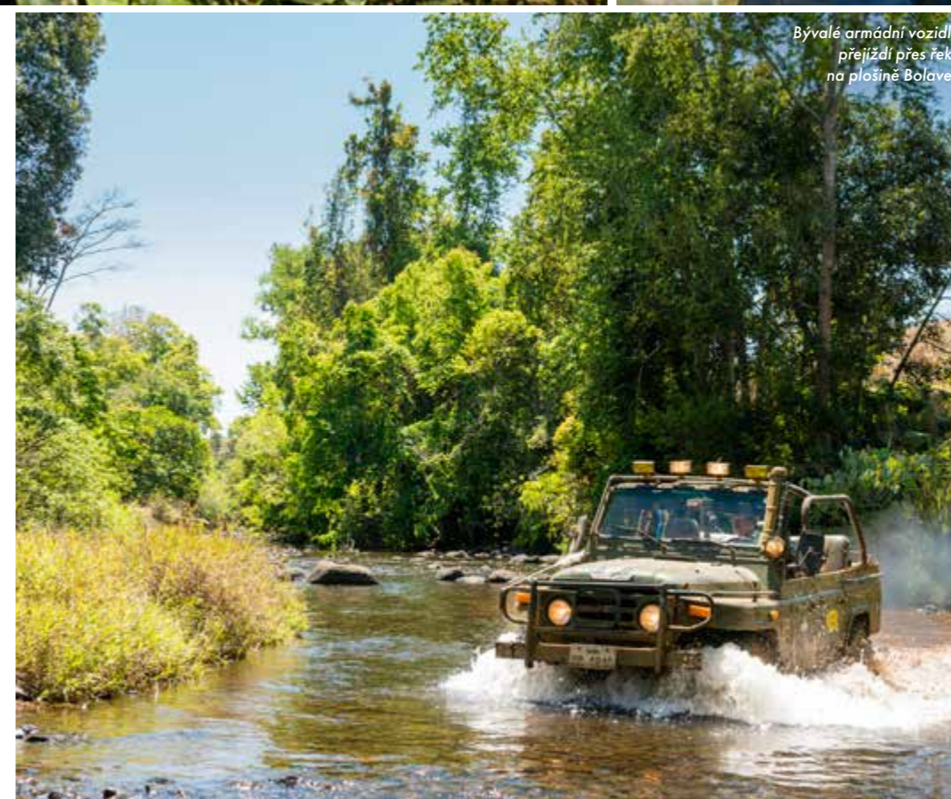
Bývalé armádní vozidlo přejíždí přes řeku na plošině Bolaven