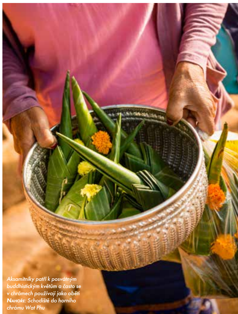
Aksamitníky patří k posvátným buddhistickým květinám a často se v chrámech používají jako oběti NAHORĚ: Schodiště do horního chrámu Wat Phu

„Když člověk vyrábí oběti pro poutníky, musí být pečlivý a trpělivý,“ říká, když splétá stonky květin. „Jasně že bychom chtěli, aby byly všechny dokonalé, ale to nejde. I přesto se ale pokoušíme znovu a znovu. Myslím, že je to dobrá lekce pro život,“ dodává.