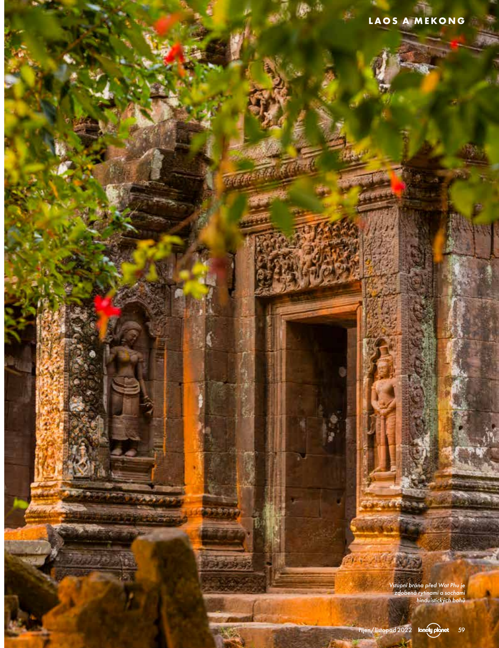
Vstupní brána před Wat Phu je zdobená rytinami a sochami hinduistických bohů

V cestě jim ale stála malá překážka – hučící vodopád Khone Phapheng, největší v celé jihovýchodní Asii. Je čtyřikrát širší než Niagarské vodopády a jeho průměrný průtok je desetkrát větší než na Viktoriiných vodopádech. Vypadá jako vařící kotol zpěněné bílé vody narážející do rozebraných skal a balvanů. Asi vás tedy nepřekvapí, že žádná loď se přes tento vodopád nedostane. Tato nepřekonatelná překážka proto nakonec velkolepé francouzské plány zmařila. Mekong je zkrátka nezkrotitelný. Inženýři se proto rozhodli vyřešit dopravu po regionu jiným způsobem – postavili 6 kilometrů dlouhou železnici přes ostrovy Don Det a Don Khon. ➔