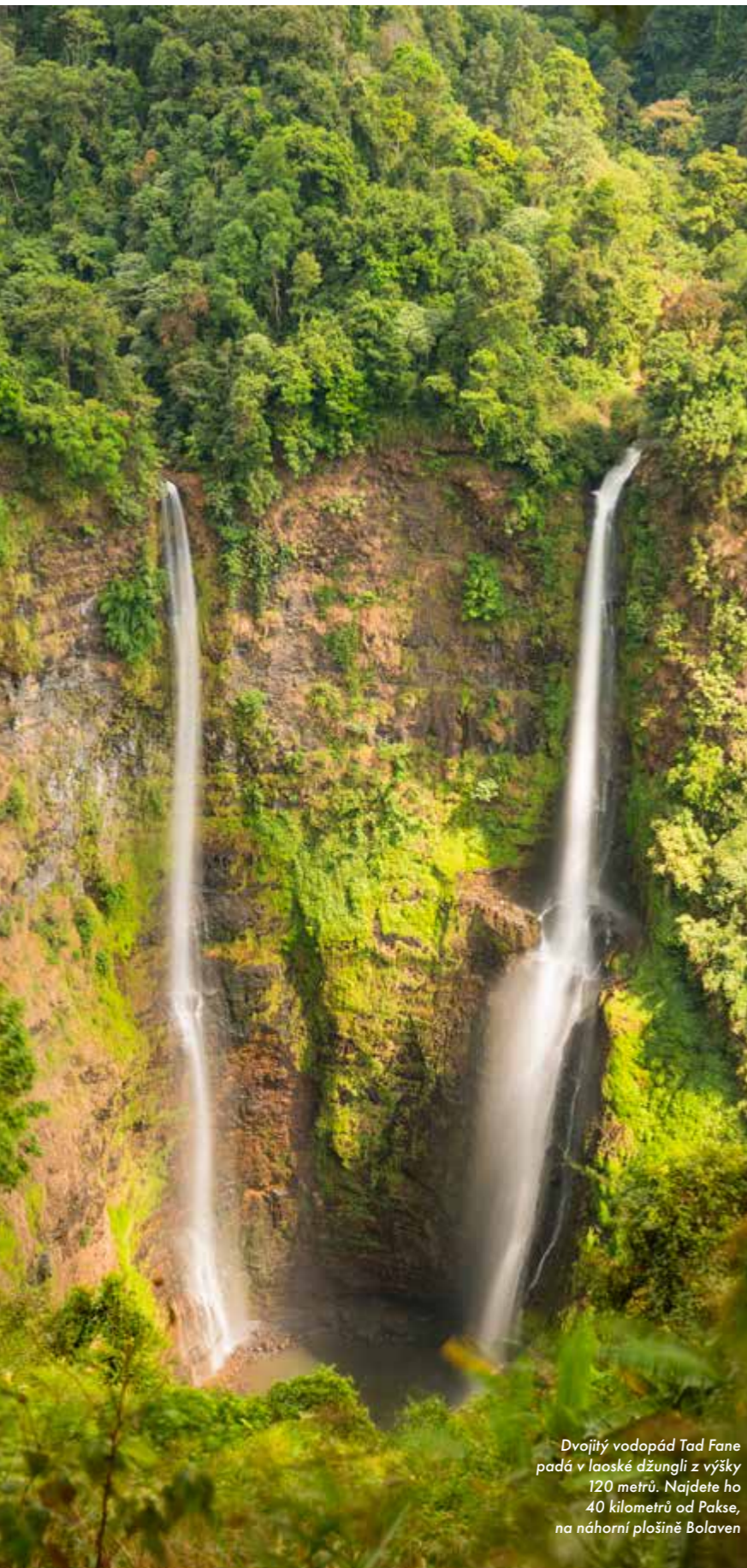
Dvojitý vodopád Tad Fane padá v laoské džungli z výšky 120 metrů. Najdete ho 40 kilometrů od Pakse, na náhorní plošině Bolaven