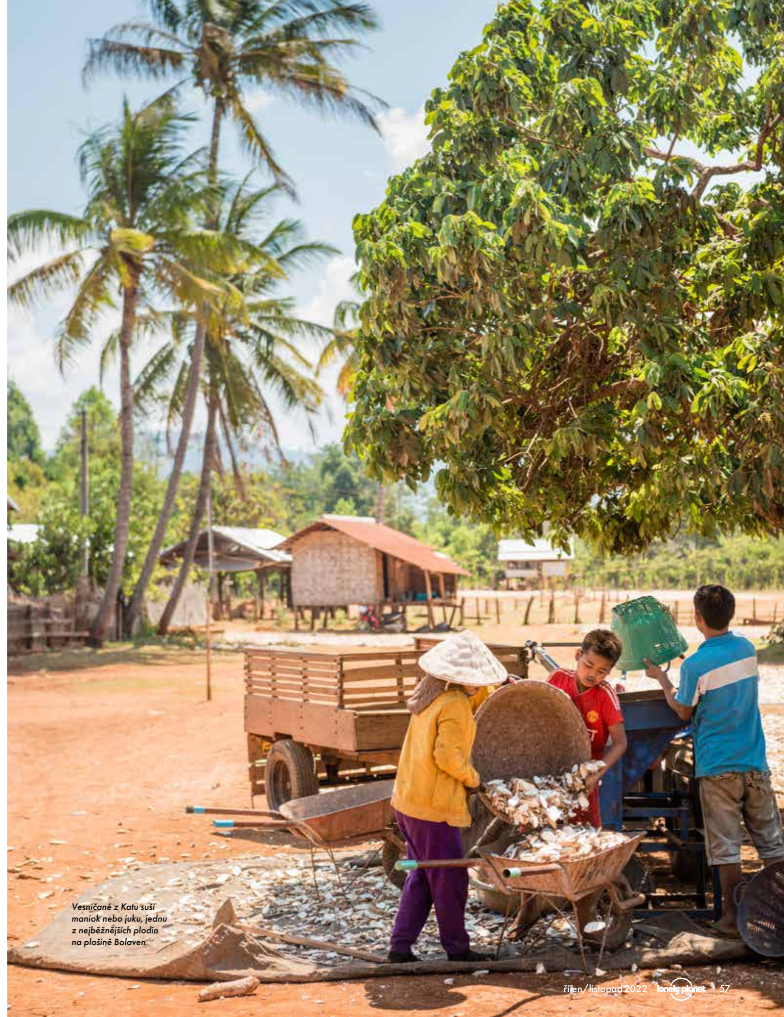
Vesničané z Katu suší maniok nebo juku, jednu z nejběžnějších plodin na plošině Bolaven

Mezi městem Pakse a plošinou Bolaven stojí u silnic malá železářství, kde místní svého oboru vyrábí nože a mačety, které zde místní využívají k práci. Toto odvětví se začalo vyvíjet v dobách války ve Vietnamu, když místní začali využívat šrapnelů z bomb a vyráběli z nich nástroje. Na Laos padly během tohoto konfliktu dvě miliardy tun bomb, takže o kov opravdu nebyla nouze. Dnes již našťastí pochází většina materiálu na farmářské nástroje z vyřazených aut.