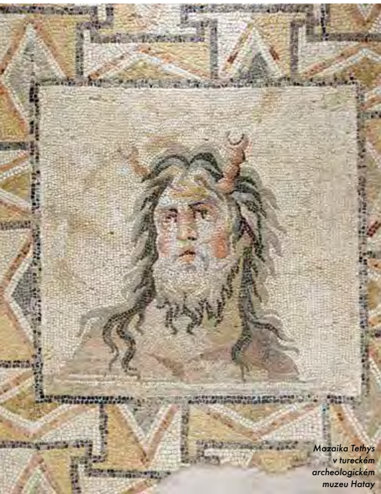
Mozaika Tethys v tureckém archeologickém muzeu Hatay