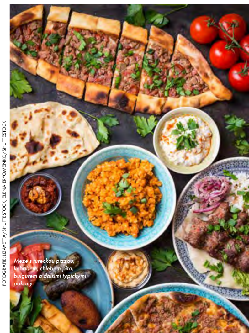
Meze s tureckou pizzou, kebapem, chlebem pita, bulgurem a dalšími typickými pokrmami

Obchod s tradičními tureckými koberci v Kapadocii