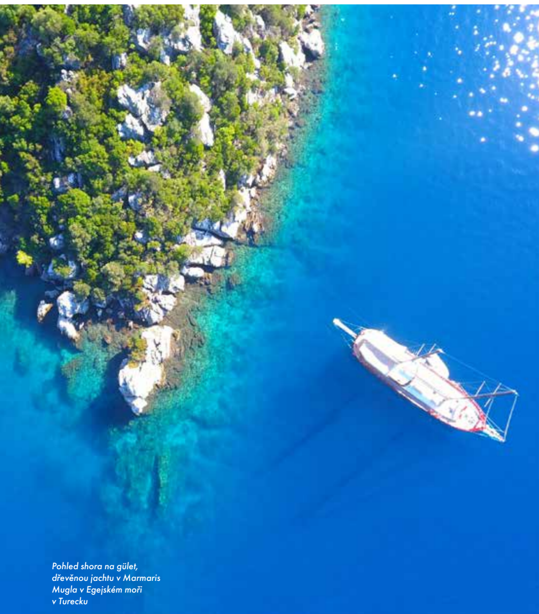
Pohled shora na gület, dřevěnou jachtu v Marmaris Mugla v Egejském moři v Turecku